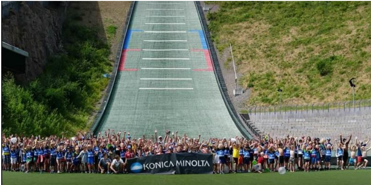
Bild från Storsamlingen i Oslo