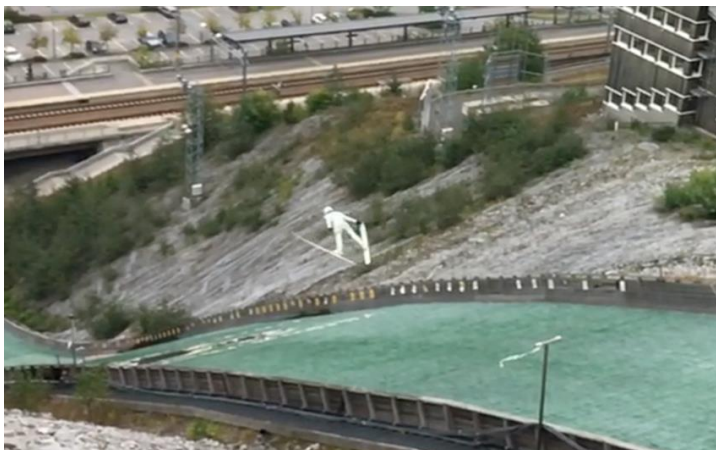
Bild från träning K90 i Ö-Vik

Ännu fler av ungdomarna har också under året kommit upp i allt större backar och klubben har nu flera barn som nu frekvent åker på läger i andra anläggningar där de kan tillfredsställa sina utmaningar i 50-60 och 90 metersbackar. Mycket glädjande är att två till av våra ungdomar nu har tagit steget upp och hoppat i K90-backe. Klubben har nu också en guldmedaljör i JSM k90. Samma ungdom (16år) tog även en silvermedalj på senior SM. Detta belyser vikten av att få vår 60-metersbacke så att dessa barn kan fortsätta att känna utmaningar och vidareutvecklas som backhoppare.